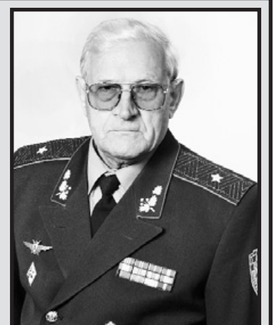
Командування, Вчена рада та науково-педагогічні працівники Національного університету оборони України імені Івана Черняхівського.